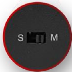
DEEP Switch (송신기 / 수신기 전환)