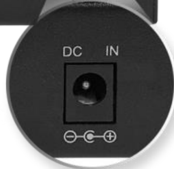
DC 48V(Peak Value 44~56V)