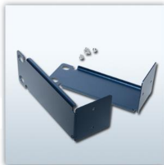
19인치 랙 키트 (옵션)