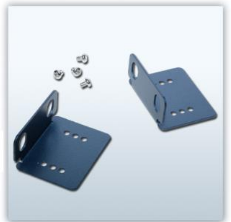
정면 패널 키트 (옵션판매)