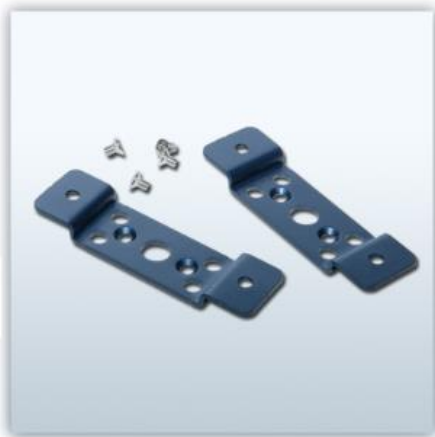
벽면 키트 (기본제공)