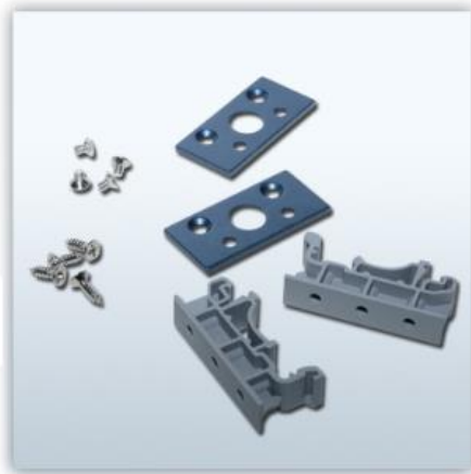
35mm 딘레일 키트 (옵션판매)