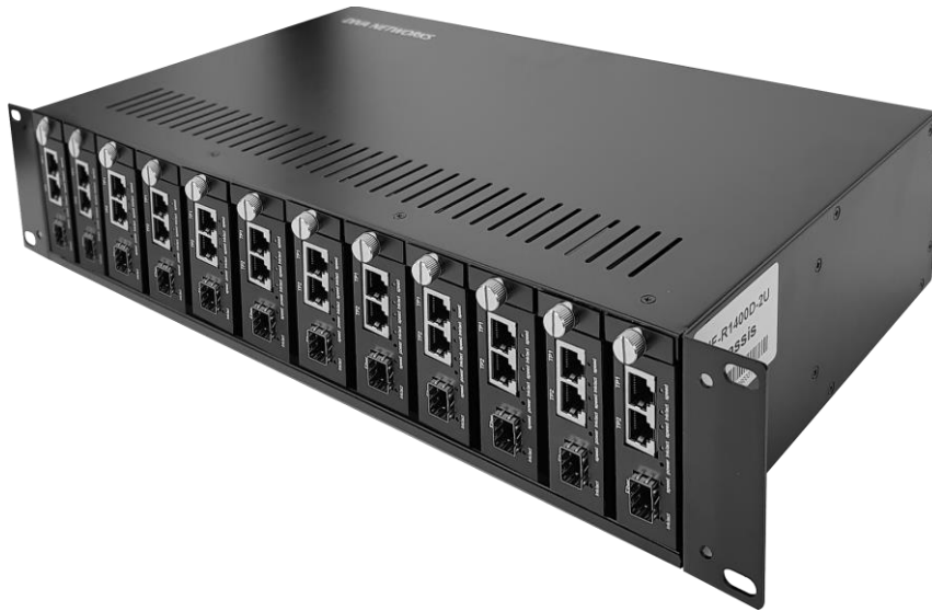
429 x 230 x 90 mm

전용 집합형 샤시를 사용하면 센터에서 여러 대의 미디어 컨버터를 집중화하여 효율적으로 운용할 수 있습니다. 최대 14개의 DIVA-ME 시리즈를 집합형 샤시에 장착할 수 있으며 AC 전원을 이중으로 연결하여 안정성을 향상시킵니다. 전용 집합형 샤시는 2U 사이즈로 19인치 랙 장착 구조를 제공합니다.